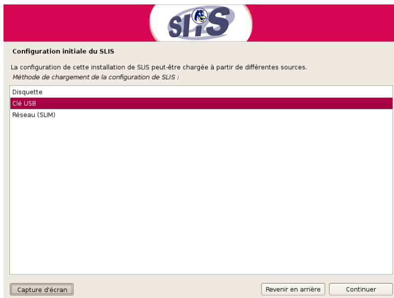
Choix de la source de configuration